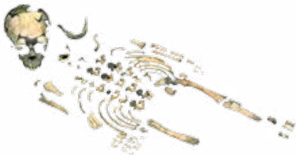
Enfant Néandertalien du Roc de Marsal

15h | visite découverte au Musée national de Préhistoire | 1h Au-delà des mots, les gestes funéraires