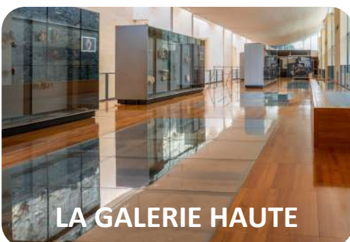
LA GALERIE HAUTE