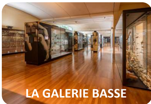
LA GALERIE BASSE

Le second étage présente les objets par thématique :