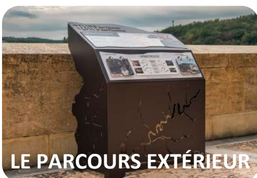
LE PARCOURS EXTÉRIEUR

Sur les terrasses du musée où vous pourrez profiter d'une magnifique vue sur la vallée, un parcours ludique "Temps des falaises, Temps des Hommes" comprenant 12 dispositifs a été installé pour accompagner la visite. Découvrez ainsi le contexte paysager, environnemental et historique dans lequel s'inscrit le musée.