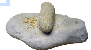
Broyeur à céréales

? Cette technique a pu être utilisée mais les preuves archéologiques manquent.