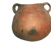
Récipient en terre cuite