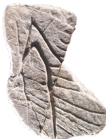
Plaque de grès fin gravée - Grotte du Loup, Cosnac, Corrèze, 38 000 BP

Le fonds des collections, constitué dès les premières années du XX e siècle par Denis Peyrony, est issu des grands gisements classiques du Périgord. Il s'est considérablement enrichi ces 25 dernières années sous l'impulsion de fouilles récentes offrant une vision, élargie au sud de la France, des implantations humaines paléolithiques. Aujourd'hui, le Musée national de Préhistoire possède plus de six millions de pièces. À ce titre, il est au premier rang des musées consacrés à l'archéologie